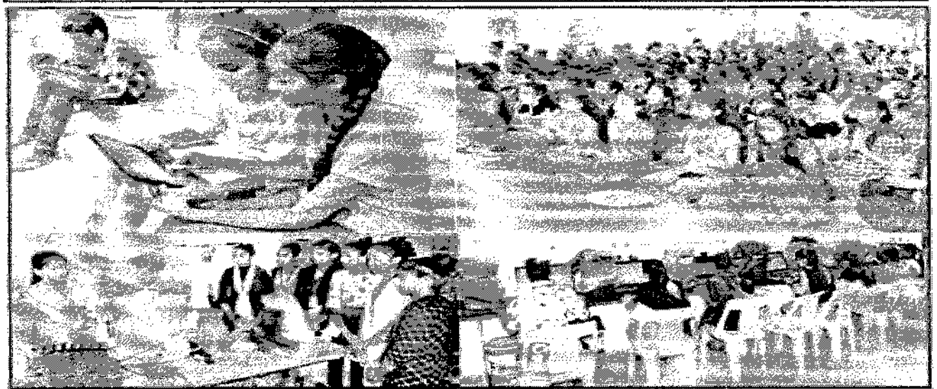
અમરેલી, તા. ૬

“નમો લક્ષ્મી સ્કોલરશીપ” યોજના અંતર્ગત વિદ્યાર્થીનીઓના શિક્ષણને મળ્યો મજબૂત આધાર