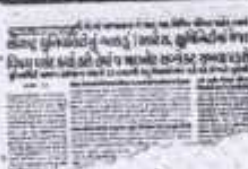
૦૮૯૨૨૭ સપ્ટેમ્બર 2025ના દિવસે ૨૭૯૦૦૦ પ્રતિષ્ઠિત ૬૪૦૦૦૦

સૌરાષ્ટ્ર યુનિવર્સિટી સંલગ્ન આર્ટસ કોલેજોમાં અભ્યાસ શરૂ થઈ ગયાના બે માસ બાદ ગત 3૭ સપ્ટેમ્બરે એક પરિપત્ર જારી કરી સત્તાધીશોએ બેચરલ ઓફ આર્ટસમાં અભ્યાસ કરતા વિદ્યાર્થીઓએ આર્ટસમાં મેજર વિષય રાખ્યો હશે તો માઈનર વિષય પણ આર્ટસનો રાખવો પડશે અને જો હ્યુમિનિટીમાં મેજર વિષય રાખ્યો હશે તો માઈનર વિષય પણ હ્યુમિનિટીના જ રાખવા પડશે તેવો તથ્યલખી આદેશ કર્યો હતો જેના પરિણામે કોલેજોના સંચાલકોમાં ભારે ઊંડાપોહ મચી ગયો હતો અને 20 હજારથી વધુ વિદ્યાર્થીઓના હવે બે માસ બાદ વિષયો ફેરવવા પડશે તેવી ગંભીર સમસ્યા સર્જાતા 'દિવ્ય ભાસ્કરે' આ સમસ્યાને વાચા આપી હતી અને તેના પગલે ગણતરીના દિવસોમાં